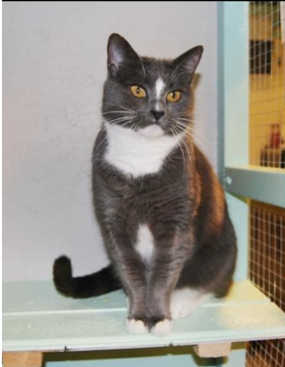
Siri (grå) och Sotis (svart)

Sotis och Siri är två katter som ville säljas tillsammans. Sotis var en grabb på 6 år och Siri en tjej på 4 år. De ville kunna få gå ut i sitt nya hem. Mycket sociala och trevliga katter.